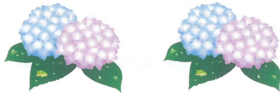
令和5年度豊原まちづくり協議会役員名簿

校区住民の皆様、どうか現状をご理解のうえ、活動へのご参加とご協力をよろしくお願い致します。