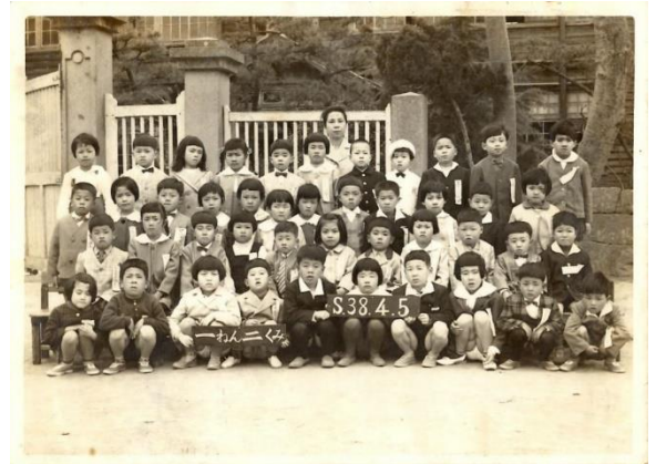
昭和38年 新入生の子どもたち