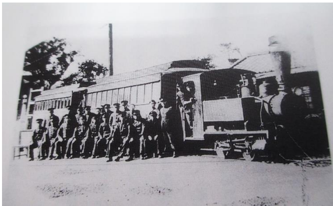
明治42年 柳河軌道停車場(隅町)