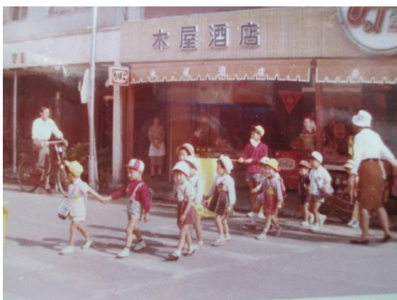
昭和40年 通りでの交通指導