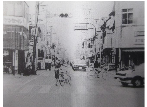
昭和40年 辻町交差点