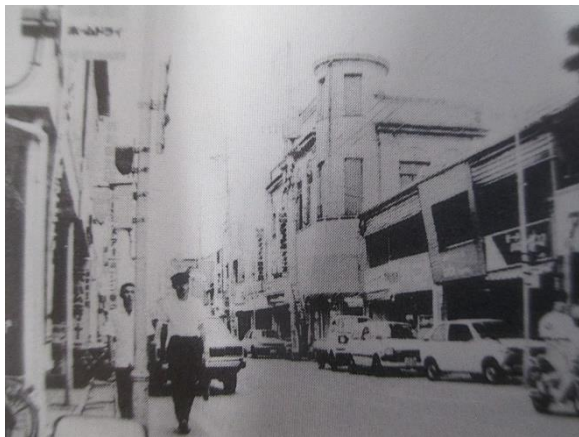
昭和40年 京町交差点付近