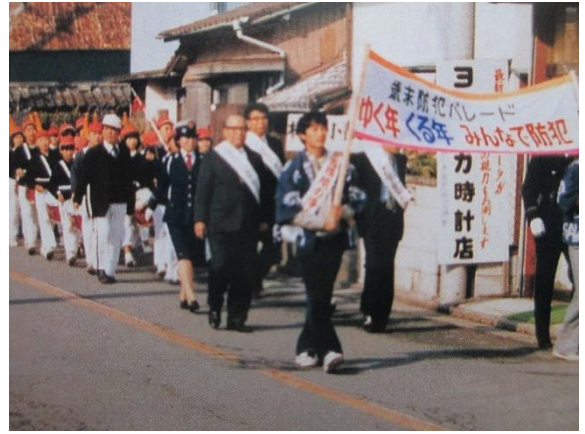
昭和60年 鼓笛隊パレード

これより下の写真は、年代が分からないので、順不同で写真だけ載せております。ご了承ください。