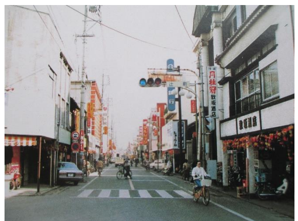
昭和59年 辻町交差点