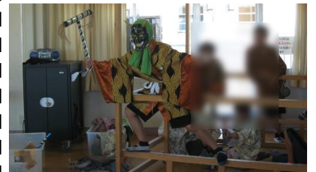
子どもどろつくどんの練習風景