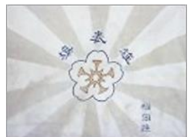
旌表旗(校長室保管)