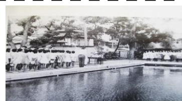
初めてのプール開き