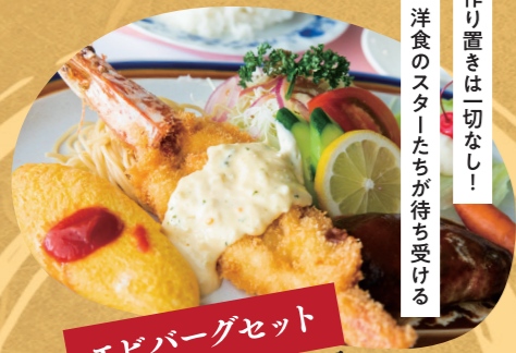
エビバーグセット レストラン辰巳屋