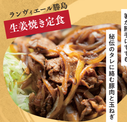
ランヴェール勝島 生姜焼き定食