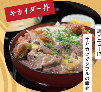
なじみ キカイダー丼