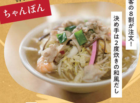
喜よし食堂 ちゃんぼん