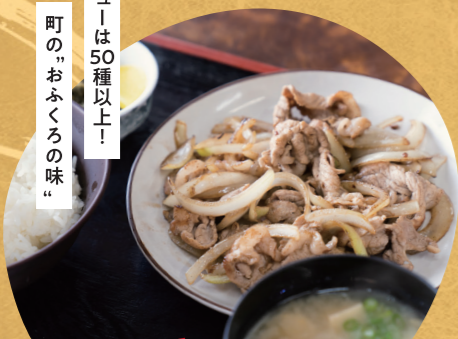
肉炒め定食 大津屋