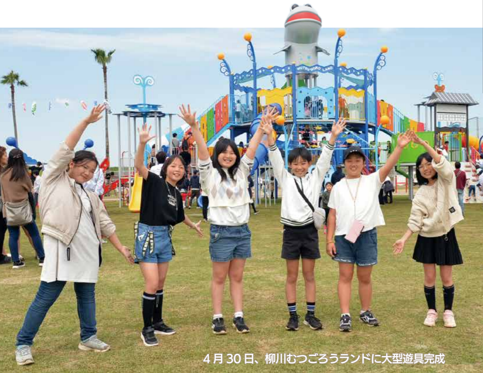
4月30日、柳川むつごろうランドに大型遊具完成