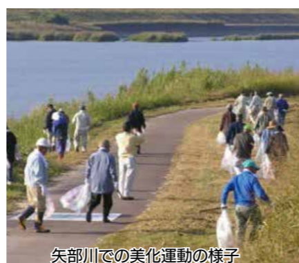
矢部川での美化運動の様子