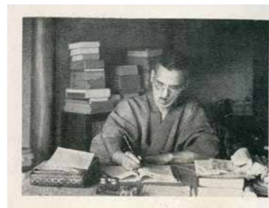
【写真1】浅川漏泉(「武士道亀鑑足達八郎」口絵)