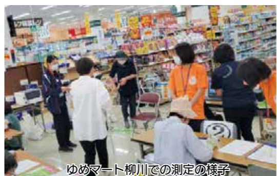
ゆめマート柳川での測定の様子