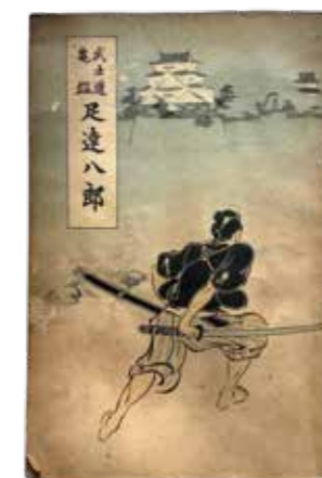
【写真2】「武士道亀鑑足達八郎」初版