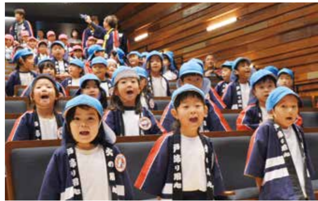
元気いっぱい防火を誓う幼児たち

8月31日、水郷柳川水まつり2025「スイ！水！すい！」の第2部がからたち文人の足湯公園で開催されました。「水辺は遊び場 水辺のまちの新しい楽しみ方」がテーマの同イベント。8月3日の第1部でも行ったサップとソーラーボート体験に加え、カヌーや船頭体験などを行いました。カヌーを体験した親子は「水が冷たくて気持ち良い」「子どもと体験できて良い思い出になった」と楽しそうに話してくれました。水辺の体験の他にも、どんこ舟をこいでタイムを競う掘割エイトや、細い木材を組み合わせる組子、鵜飼いのショーなどが行われ、会場は大いににぎわいました。