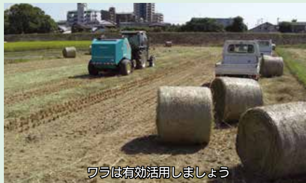
ワラは有効活用しましょう

定められた方法以外でごみを焼やす「野外焼却」は、廃棄物処理法で禁止されています。農業を営むための廃棄物の焼却は、例外的に認められていますが、場合によっては行政指導などの対象となります。農地での野焼きは、隣接する家屋や田などに燃えうつり、火事の原因になります。近隣自治体では、稲わらを焼却中に送電鉄塔を焼損した事例があります。送電鉄塔が破損すると、停電を引き起こすだけでなく、鉄塔の器物破損として加害者に多額の損害賠償を請求されることがあります。