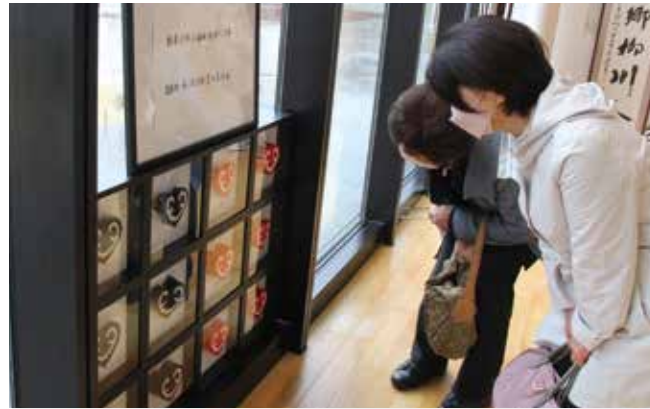
展示作品を興味深そうに眺める来場者たち