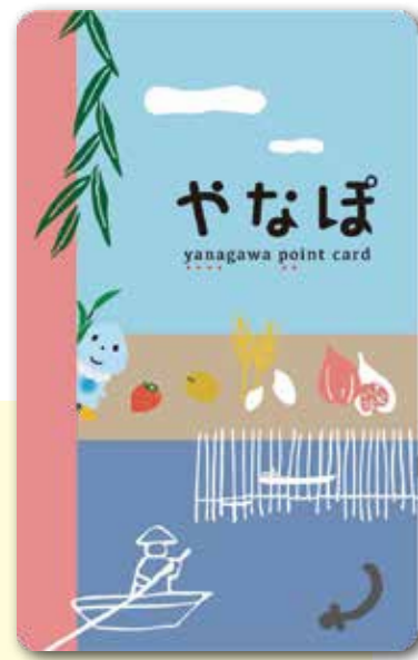
お買い物カード「やなぼ」