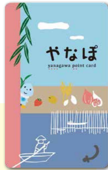
お買い物カード「やなぼ」