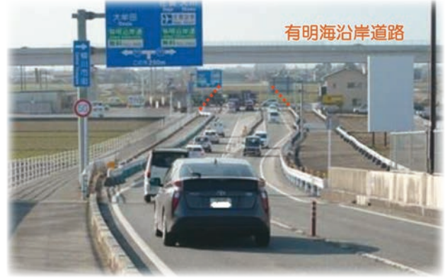
国道443号線バイパス（徳益IC付近）

答 市長 発信力の弱さは感じていた。来年の4月にはネーミングを変えて、人材を含め、やる気満々な職員の登用を考えている。今は誘致する場所はないが学校再編成後の校舎の再利用もある。DX等の通信計画に大牟田市が入ってくることを踏まえて総合的な取組みを約束する。