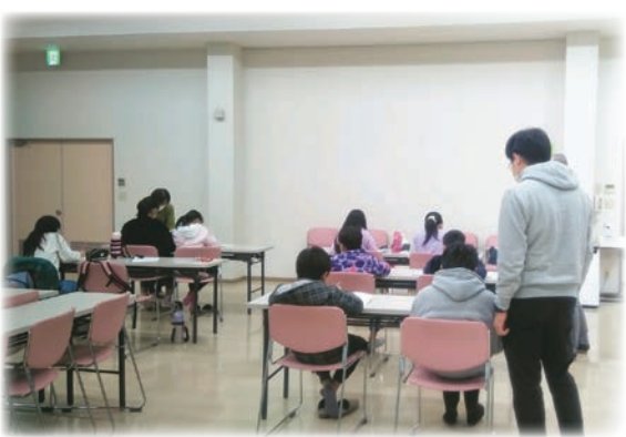
(参考資料)県が主催する「ひとり親家庭の学習支援」の様子

答 教育長 コロナ禍が明けののを待たずにスケジュール化をしっかりと図りたい。地域学校協働本部も小学校区にできた。研修会もこれに特化しながらタイムスケジュールも示しながら具体的にやっていく決意である。