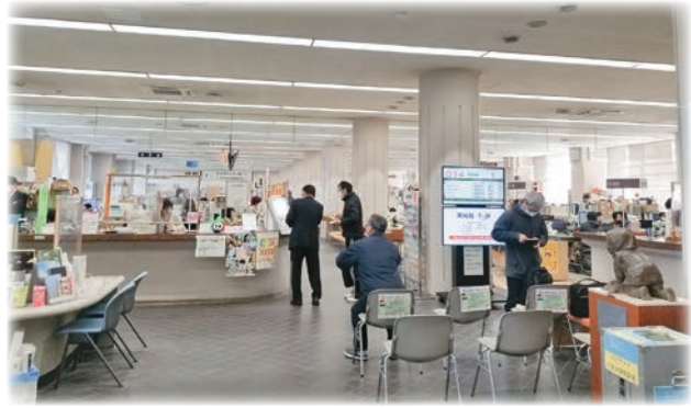
現在の柳川庁舎市民課窓口

柳川庁舎統合とは切り離して協議・対応するとの事だが、庁舎の増築は市としても大きな変革期。大胆な取組みもできる。