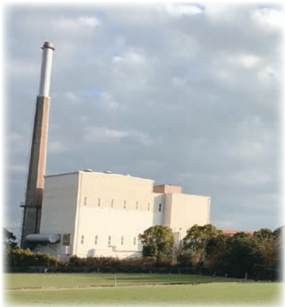
旧クリーンセンター（佃町）の全景

答 市長 市内小学校の陸上記録会は大牟田市の記念グラウンドで開いた。柳川市内に整備すれば大牟田市まで貸切バスで行かなくともできるようになる。