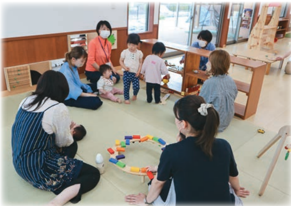
「このゆびとまれ」での親子のふれ合い

高齢は86歳、デイサービスに行 かなくてもよくなったという人 もいる。教室を増やすべき。 1教室100万円、安いもの、 是非継続を。