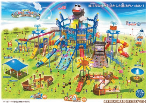
大型複合遊具イメージ図

都市計画課長 市民アンケートでは保育料、医療費に次いで公園整備の充実を求める声が多く市外の公園を利用されている。むつころうランドの整備については令和4年度末の完成を目指し他8つの公園の遊具や設備の改善について計画的な整備を考えている。