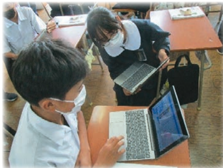
プログラミング教育プロジェクト公開授業

「Scratch」というソフトでプログラムを組みながら入力し、何度も三角形を拡大したり、縮小したり「トライアンドエラー」でチャレンジした楽しい学習でした。