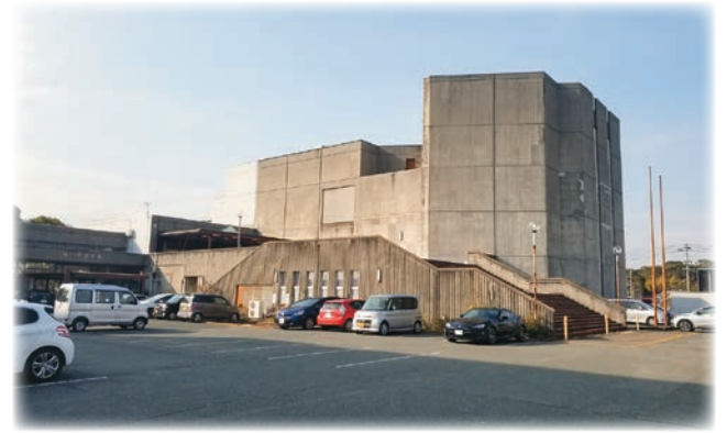
解体後庁舎増築予定の旧市民会館

財政課長 市民が利用しやすい空間・設備を目指し、誰もが安心して快適に利用できるような庁舎にしたい。