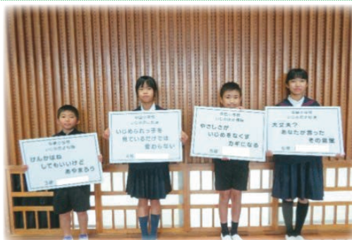
校内いじめ防止標語づくり

4年生の児童が、自分たちが育てた野菜や仕入れた商品を並べて、朝市体験を行いました。商店街広場を訪れた方々を相手に、品物売る元気な声を響かせていました。