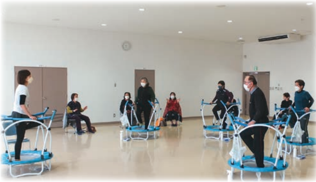
ケアトランポリン教室

が、相談窓口は複数あり、自分 で探さないといけない。 介護保険は、ケアマネージャ が介護度に応じて様々なサービ スを紹介してくれる。子育て も、相談に応じてサービスを紹 介してくれるコーディネーター 的な人員配置を。 介護費用抑制事業のなかで、 「ケアトランポリン教室」は人 気だが、「県補助金の打ち切り で豊原コミセンの教室が無くな る」とのこと。利用者は、継続 を熱望されている。利用者の最