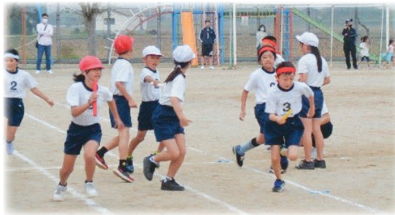
スポーツフェスタ

「Scratch」というソフトでプログラムを組みながら入力し、何度も三角形を拡大したり、縮小したり「トライアンドエラー」でチャレンジした楽しい学習でした。