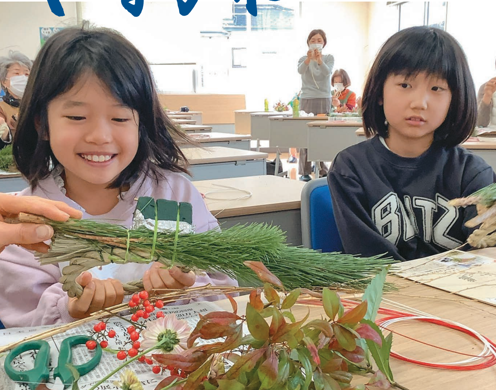
中島コミュニティセンターによるしめ縄作り教室