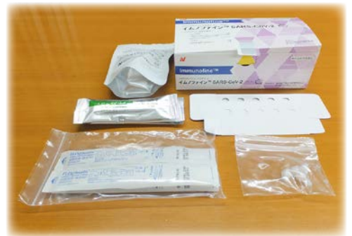
抗原定性検査キット

健康づくり課長 発熱等の症状がある場合は、かかりつけ医等の地域で身近な医療機関に電話で相談してから受診していただきたい。迷った場合等は、福岡県が設置する受診・相談センターに電話を。本市の最寄受診・相談センターは南筑後保健所内にあり、平日8時30分から17時15分までは0944・68・5224で受け付け、夜間・休日は新型コロナウイルス感染症一般相談窓092・643・3288で受け付けられる。ここで診療・検査が可能な医療機関が案内されるので、電話相談した上で受診を。