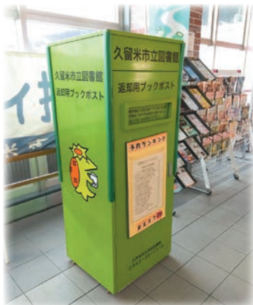
返却用ブックポスト(JR久留米駅自由通路)

図書館長 現在全7館に返却ボックスを設置。本館で休館日翌日で50冊、他の日で10冊程度。本館以外ではほとんど一桁の利用。駅への設置は利便性向上になると思うが、管理上の問題や回収職員の確保、設置費用等もあり直ちにはいかなない。