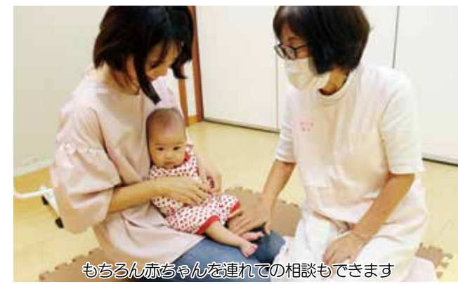
もちろん赤ちゃんを連れての相談もできます

子育ては誰でも迷ったり悩んだりするのが当たり前。でも、母親になったばかりの女性は、そんなことを考える余裕もなく、「赤ちゃんが泣くのは母乳が少ないから?」「他の子に比べて発達が遅いのはなぜ?」と1人で悩みを抱え込んでしまいがちです。