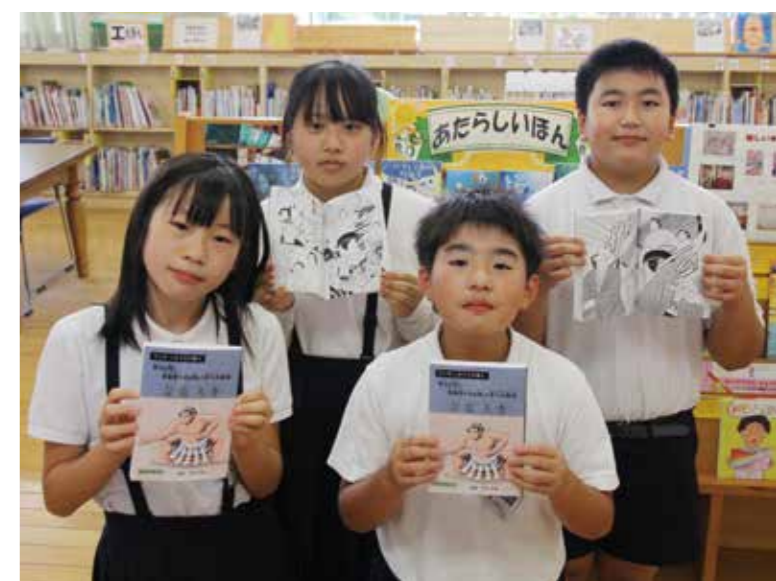
小学生にも分かりやすく製作された漫画

3年生から中学3年生までを対象に配布しました。本は非売品で図書館やコミュニティセンターに設置するほか、市公式サイトでも閲覧することができます。詳