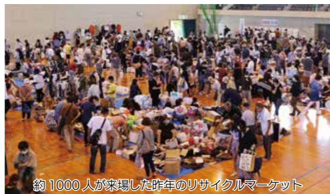
約1000人が来場した昨年のリサイクルマーケット