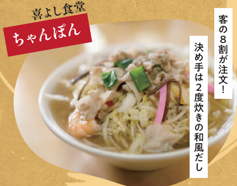
喜よし食堂 ちゃんぽん