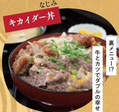
なじみ キカイダー井