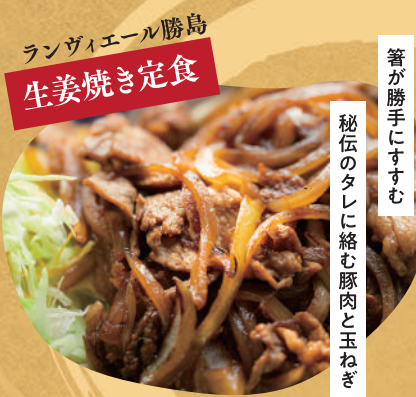
ランヴェール勝島 生姜焼き定食