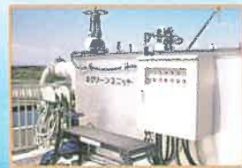
スクリーンユニット