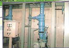
生物膜ろ過棟地下1F