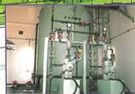
凝集剤注入設備室