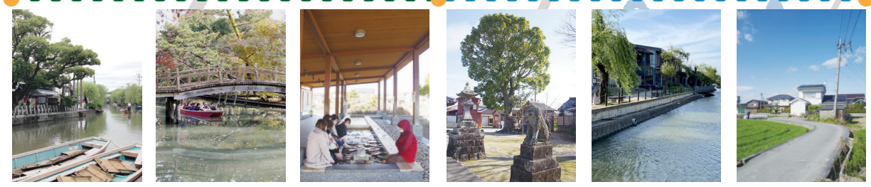
観光案内所前 出会橋(立花氏庭園南) 足湯 玉垂神社 柳並木 馬場小路