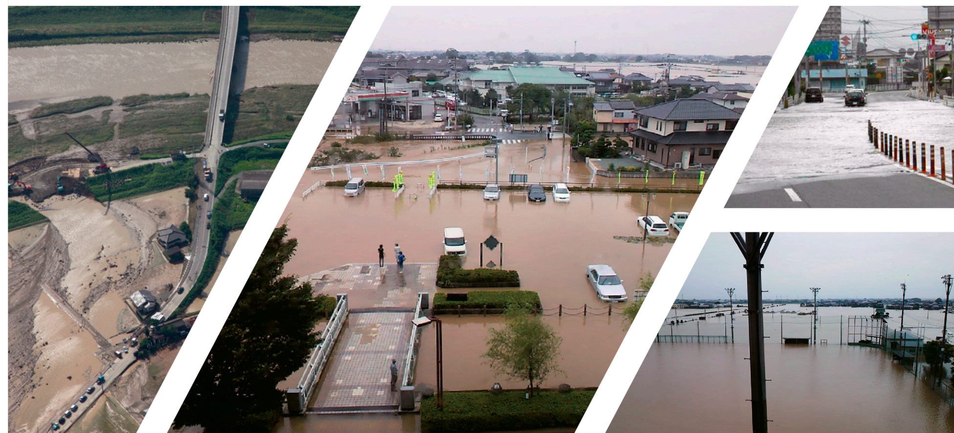
写真 平成24年7月九州北部豪雨