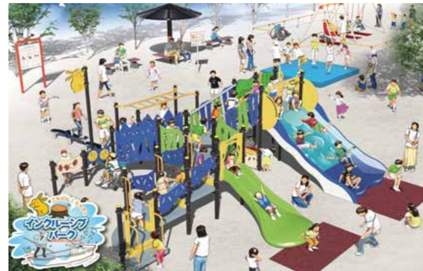
4月上旬から利用が始まる柳城児童公園のイメージ