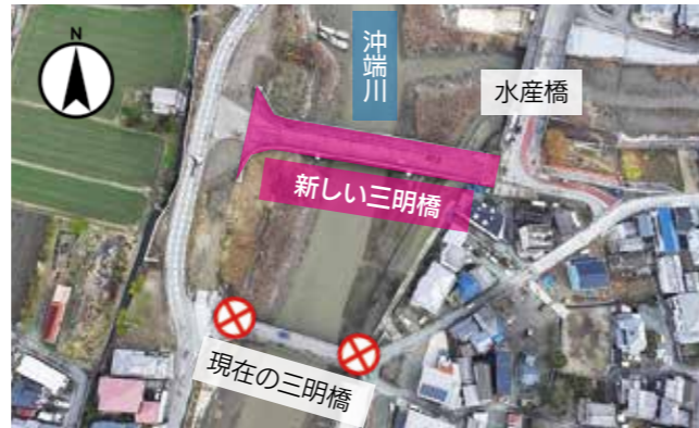
3月29日の開通後、現在の三明橋は一旦全面通行止め

【問】▷工事に関すること＝県南筑後県土整備事務所 道路課県道建設係（☎41・5116）▷その他＝市建設課（☎77・8541）