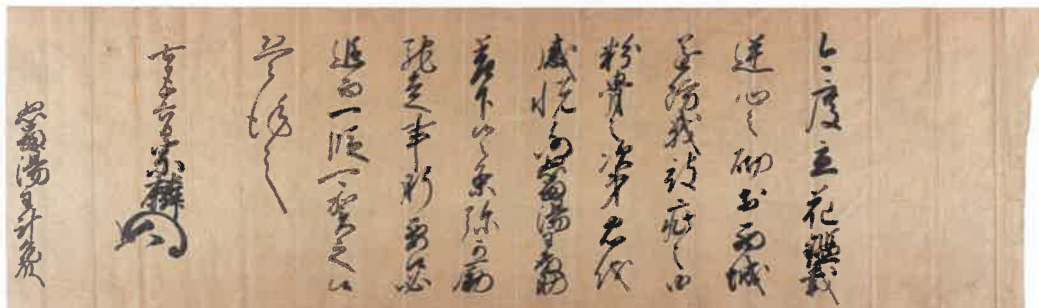
大友宗麟書状(個人蔵、大分県立先哲史料館寄託) 永禄11年(1568) 立花鑑載の「逆心」の企てに対応し、防戦した家臣を賞賛した大友宗麟の手紙