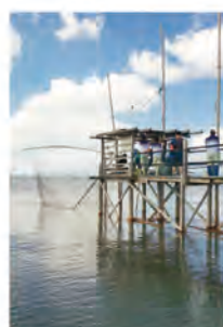
くもで網体験 / 柳川むつごろう会 ☎ 0944-72-0819