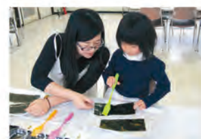
板海苔づくり体験 / 株式会社高橋商店 ☎ 0944-73-6271

柳川には、ブランドづくりから生まれた、いろんな体験ができるプログラムやツアーがあります。思い出も、ぜひ旅のお土産に。詳しくは各窓口にお問い合わせください。