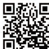
ゆるり旅ホームページ