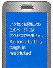
フィルタリングサービスを受けた画面表示例

●携帯電話の使用状況を話しあえる環境を作りましょう。 お子様がどのように携帯電話を使っているのか、家庭でも気軽に話し合えるようにしましょう。また、利用料金などもチェックするように心掛けてください。