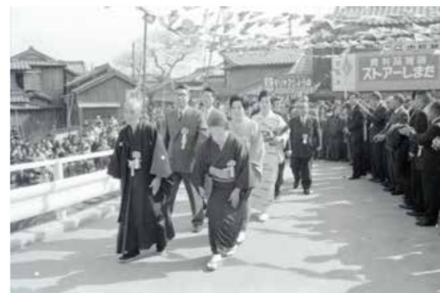
【写真2】3代目三明橋の渡初式

3月29日、沖端地区と昭代地区を結ぶ、新しい三明橋が開通しました。開通した三明橋は4代目となる橋です。そこで、今回は沖端川に架かる三明橋の古写真とその歴史を紹介します。 三明橋がある場所には江戸時代、「孫六渡」という渡し場があり、渡し舟が行き来していました。しかし、有明海が干潮のときや風雨が強いときには舟が通行できなかつたため、明治31(1898)年に初代三明橋が架けられました。ちなみに、三明橋の名前の由来はよく分かっていません。初代三明橋は、木造の跳ね橋(開閉橋)。橋守によって開閉され、マストを持つ帆船が通過できるようになっていました。 また、民間経営だった初代三明橋では、橋を渡るために橋賃(通行料)が取られていました。大正時代の柳河新報では「橋賃を取られるのは不便」との人々の声を確認できます。大正10(1921)年1月、山門郡と三瀬郡の境に位置していた三明橋は、両郡