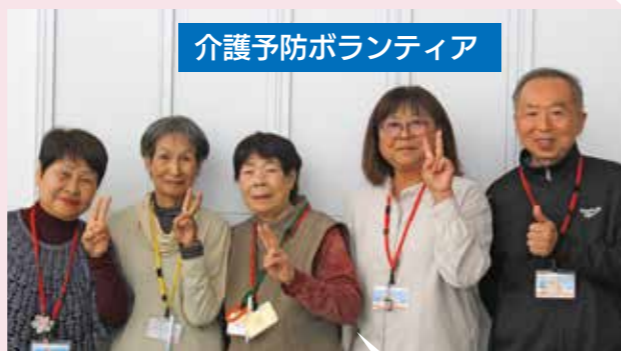
介護予防ボランティア

市社会福祉協議会が募集する気軽に行ける「ちよいぽん」。ゴミ出し、電球交換、布団干し、衣替え、窓ふき、簡単な掃除などを行います。