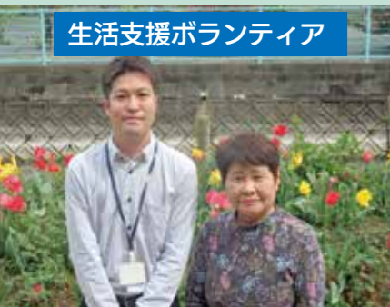
生活支援ボランティア

市社会福祉協議会が募集する気軽に行ける「ちよいぽん」。ゴミ出し、電球交換、布団干し、衣替え、窓ふき、簡単な掃除などを行います。