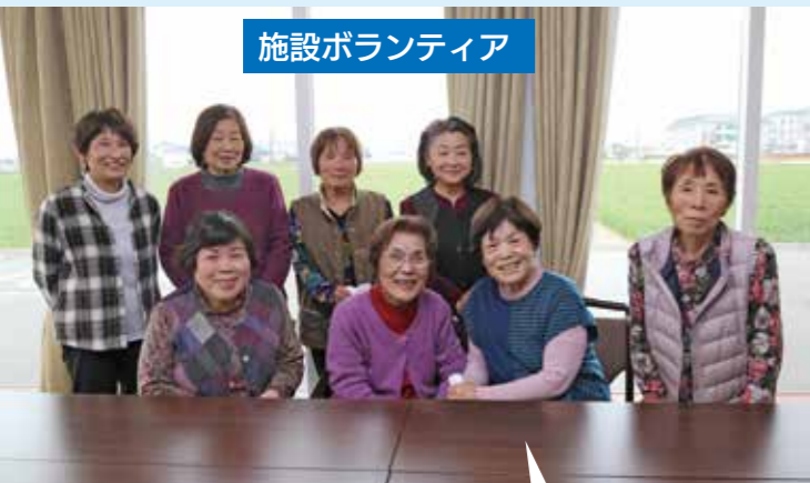
施設ボランティア

「個人の自発的な意志」から始まるボランティア活動。活動に決まった形はありません。いつでも自由に、自分のことから始めることができます。活動はいずれも1時間から2時間程度です。興味がある人はぜひ、研修会に参加してください。